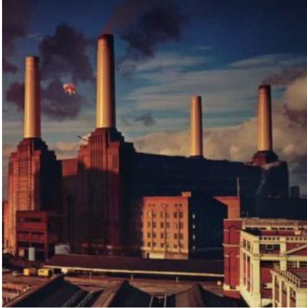
Animals/Pink Floyd (1977) Harvest

聴きまくり、以後、ピンク・フロイドのアルバムを次々と追い求めていったところ、その中の1枚が「Animals」であった。この「Animals」は、音楽面では他のピンク・フロイドのアルバムと比べるとはっきりいって凡庸な感がある（異論は認める。）ものの、そのジャケットアートは極めて秀逸であった。