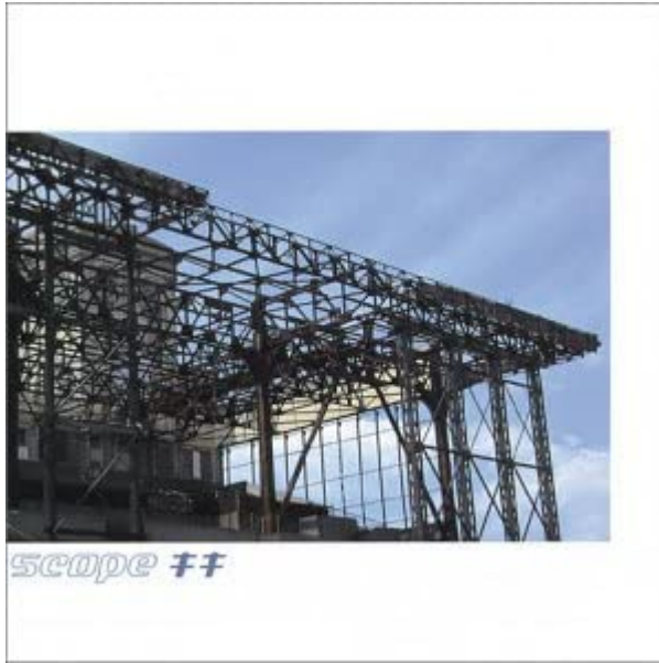
キキ/scope (2000) ダイキサウンド

この建築物が何であるのか知りたいと思い、当時、隆盛していた mixi (!) の SCOPE のコミュニティで質問したところ、横浜の根岸競馬場だということが判明し、後年、根岸競馬場を訪問した。バタシー発電所と同様に、すでに閉鎖されて廃墟化しており、印象的だった鉄骨は落下のおそれがあるということで、残念ながら撤去されてしまっていた。